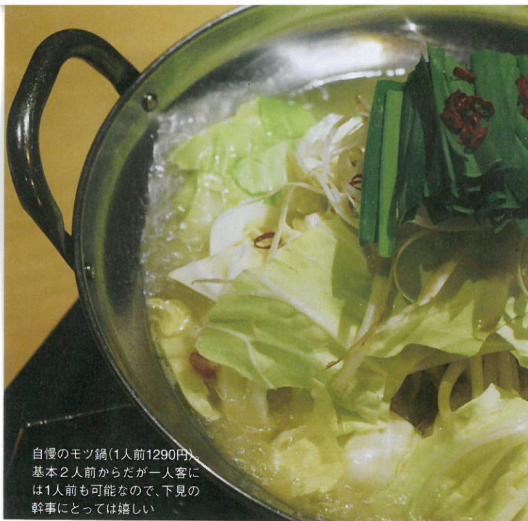
自慢のモツ鍋(1人前1290円)。 基本2人前からだが一客には1人前も可能なので、下見の幹事にとっては嬉しい

ジナルの味噌ダレで、モツの甘みを最大限に引き出してくれる。メにはラーメンがオススメ。野菜は国産にこだわりの、現在、山梨県に専用の畑を準備中とのこと。鍋料理は大量の野菜を使うので、安全安心な旬の新鮮野菜を提供したいという熱い思いからだ。酒もじっくり楽しんでもらいたいので、飲み放題は30分単位で延長可能！しかも本格焼酎もメニューに組み込まれている。また、同業者からも絶賛される生ビールは、メーカーまで研修を受けに行き、注ぎ方から洗浄まで徹底管理。常に技術の向上と味の安定を心がけている。実はこの店、一人呑みにも適し